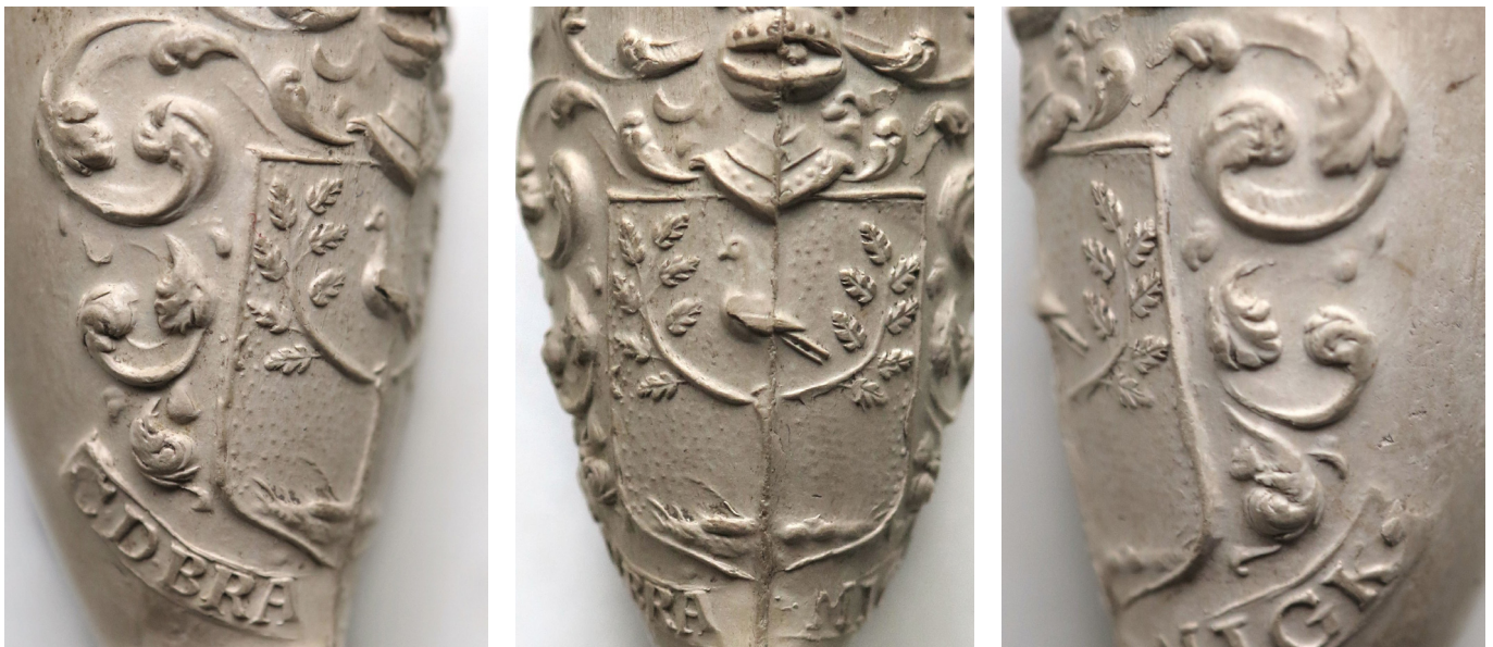
Afb. 2a-d. Details familiewapen Bramigk, helmteken en voluten. Hielmerk parel. Gouda, Abraham Eling de oude, 1740-1743/1745.